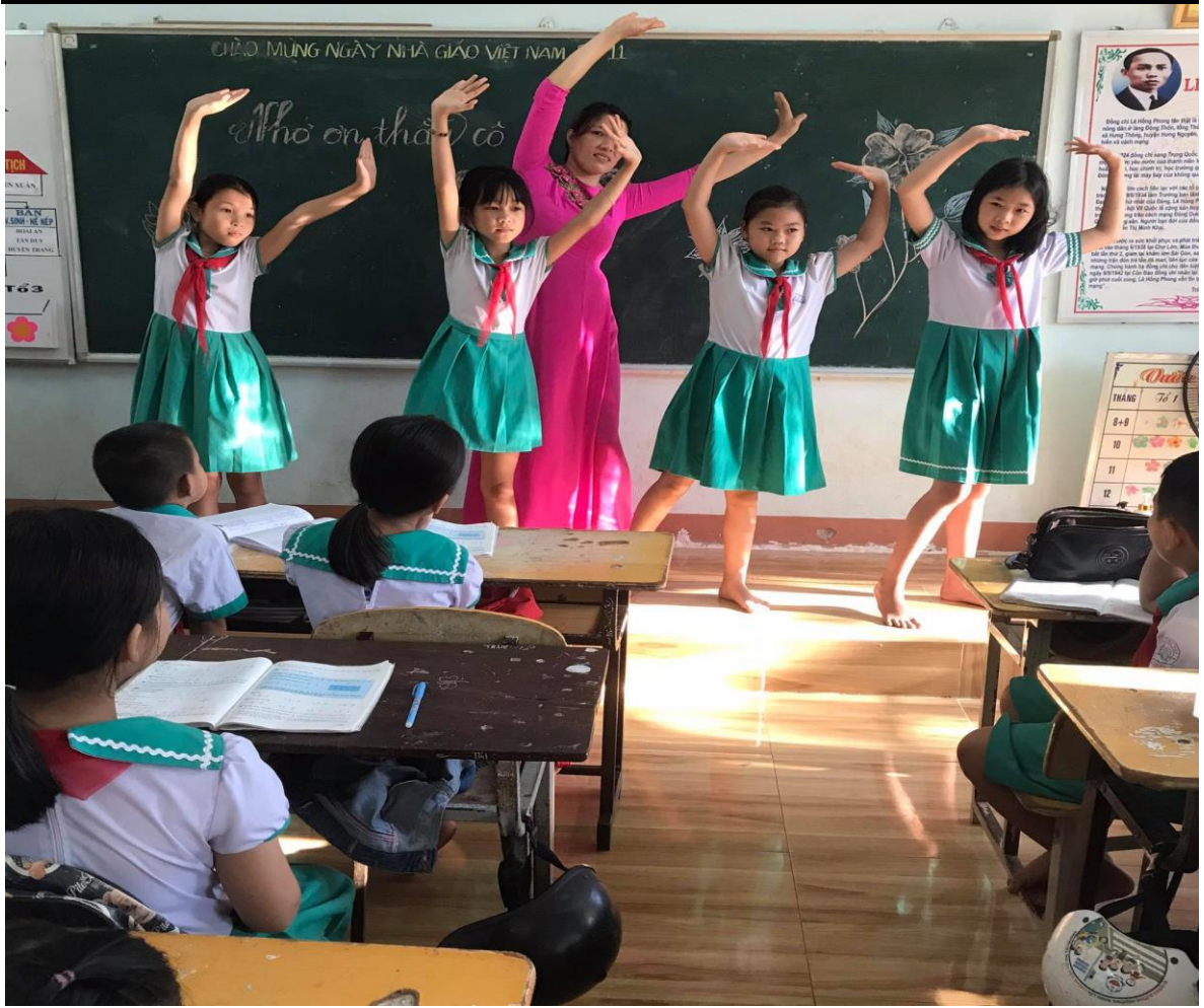
Hình tiết mục văn nghệ của cô trò nhân Ngày 20 – 11