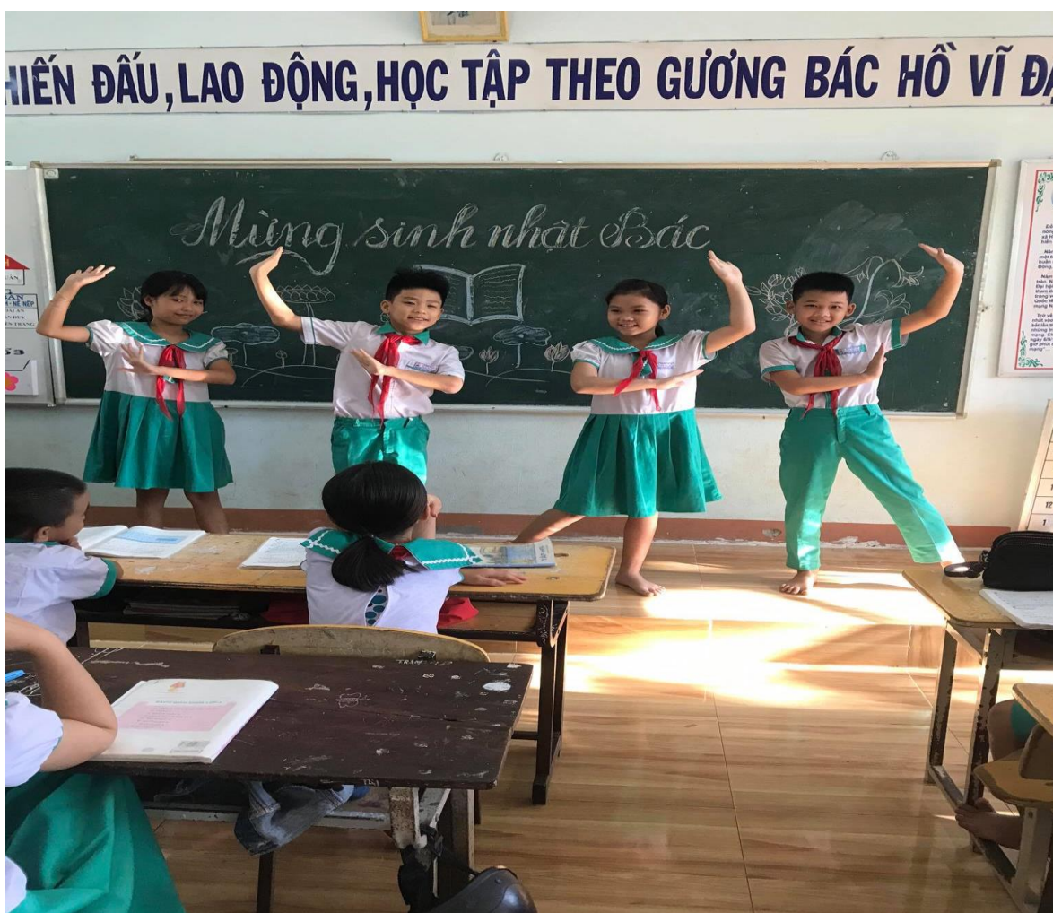
Học sinh tham gia văn nghệ trong ngày Sinh nhật Bác