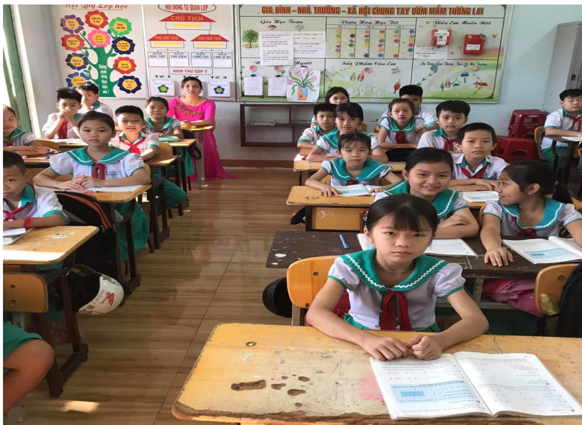
Cô trò đang thưởng thức tiết mục văn nghệ