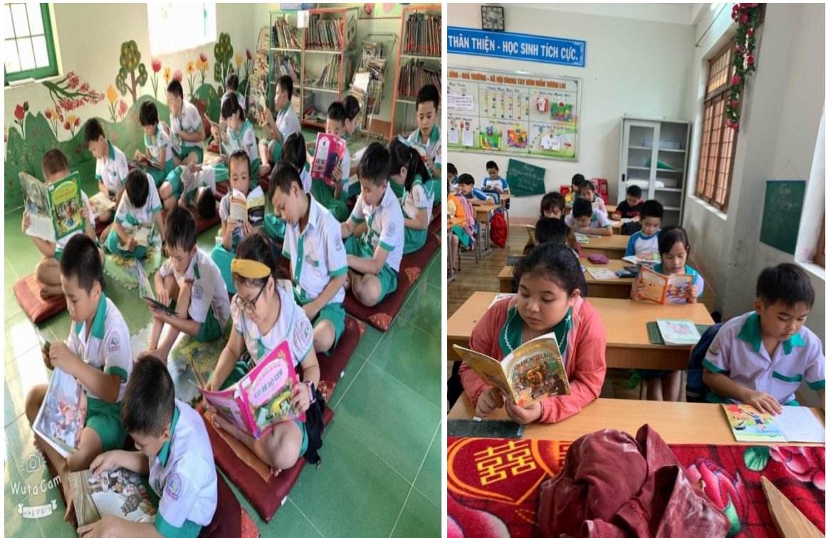
Hình: Học sinh tham gia đọc truyện tại lớp và thư viện của trường.

Trên cơ sở đó giúp các em tập luyện trong đời sống thực tế, hình thành các hành vi, tập quán hành vi lành mạnh, góp phần tạo nên lối sống phù hợp với các chuẩn mực đạo đức văn hóa.