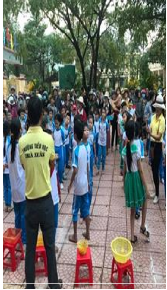
Hình: Học sinh tham gia lao động và ngày hội vui khỏe do trường tổ chức

Các buổi lao động tập thể, các cuộc thi tài năng, tổ chức giao lưu các cuộc thi tập thể giữa các khối lớp nhằm tăng thêm tinh thần đoàn kết và gần gũi nhau hơn. Khi tham gia các hoạt động tập thể tạo động lực cho các em hăng say học tập và chất lượng giáo dục ngày được nâng cao hơn.