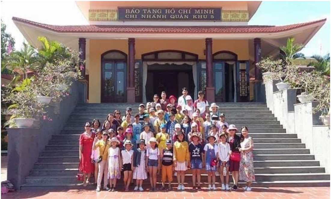
Hình: Giáo dục truyền thống lịch sử, yêu nước qua buổi tham quan thực tế.