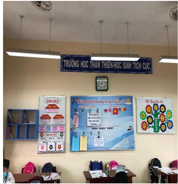
Hình: Một số quy tắc ứng xử của lớp