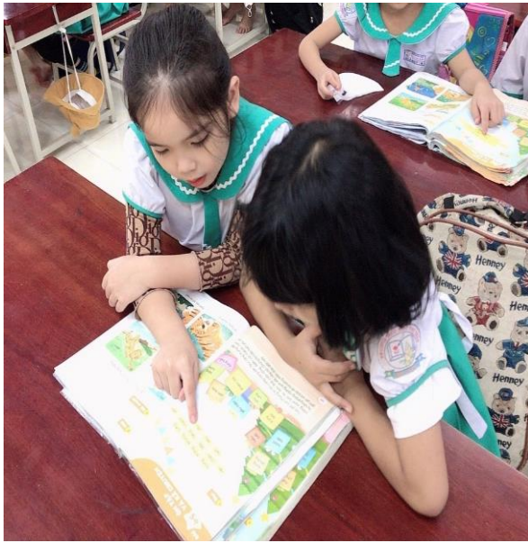
Hình: Giúp đỡ bạn trong học tập