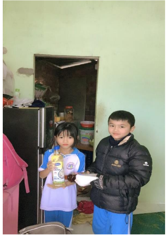
Hình: Phong trào nuôi heo đất tặng quà cho học sinh có hoàn cảnh khó khăn