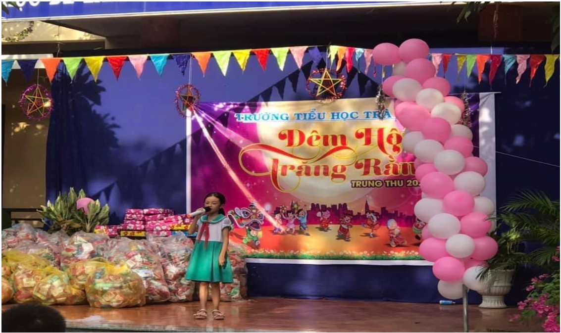
Hình: Văn nghệ vui Trung thu.

Như vậy qua các hoạt động tập thể, ngoài giờ lên lớp, từ đó nếp sống đạo đức của các em sẽ có chuyển biến tốt, trước hết là tinh thần đoàn kết, ý thức tập thể, biết giúp đỡ nhau trong mọi hoạt động. Thông qua các hoạt động tập thể các em có trách nhiệm, mạnh dạn hơn và tự biết chịu trách nhiệm về mình hơn.