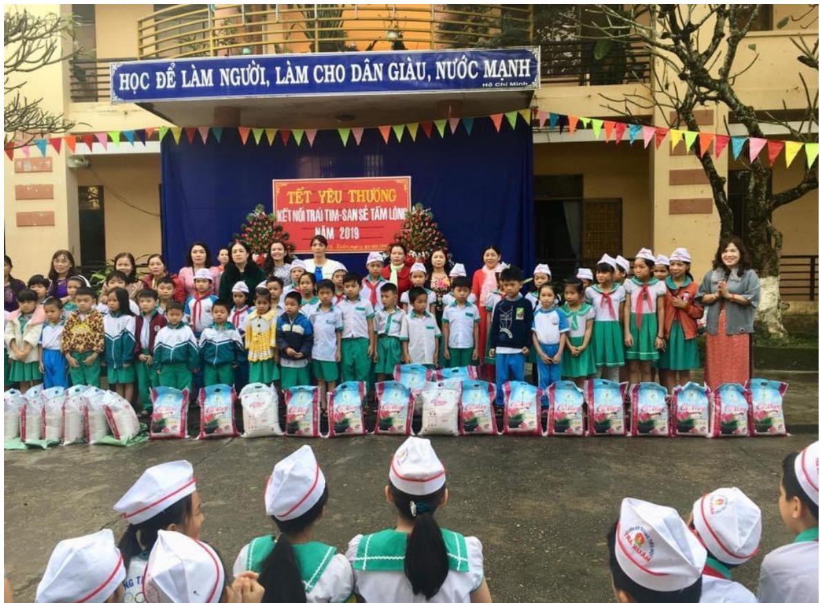
Hình: Ban giám hiệu tặng quà cho các em trong dịp Tết nguyên đán