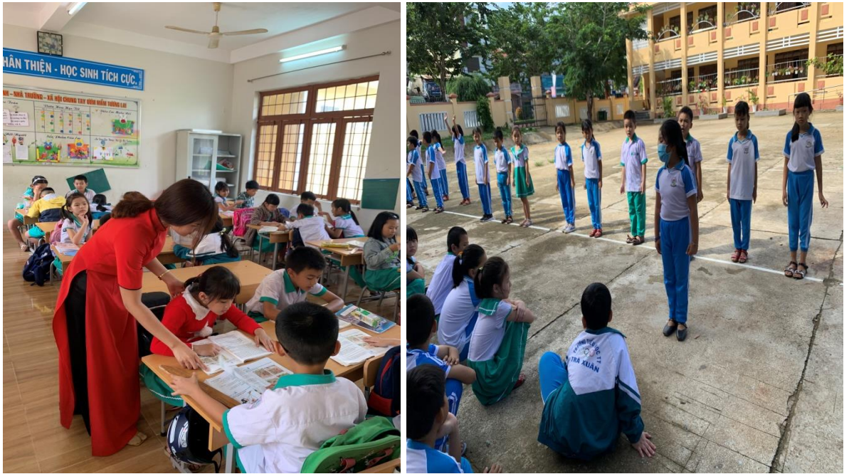
Hình: Giáo viên chủ nhiệm kết hợp với giáo viên bộ môn để giáo dục các em.

Vì vậy, muốn giáo dục kịp thời, chấn chỉnh những sai lệch cho các em trong cuộc sống, học tập hàng ngày tôi tiến hành thực hiện như sau: Đầu năm học mời phụ huynh học sinh họp, nêu lý do, tầm quan trọng của việc giáo dục đạo đức kịp thời những hành vi ứng xử cho học sinh, nắm được số điện thoại cụ thể của từng phụ huynh. Từ đó giáo viên cùng phụ huynh ký bản thoả ước, cùng phối hợp thực hiện giáo dục các em ở nhà, trao đổi thường xuyên, kịp thời những thông tin về hành vi đạo đức của các em giữa giáo viên chủ nhiệm và phụ huynh. Vào đầu năm học giáo viên chuẩn bị mỗi em 1 cuốn sổ liên lạc để ghi chép và trao đổi những điều giáo viên cùng phụ huynh học sinh. Ngoài ra khi có việc cần trao đổi thì giáo viên hoặc phụ huynh điện thoại trực tiếp để trao đổi. Qua thực hiện tôi đã nhận được thông tin phản hồi của phụ huynh học sinh hàng tuần.