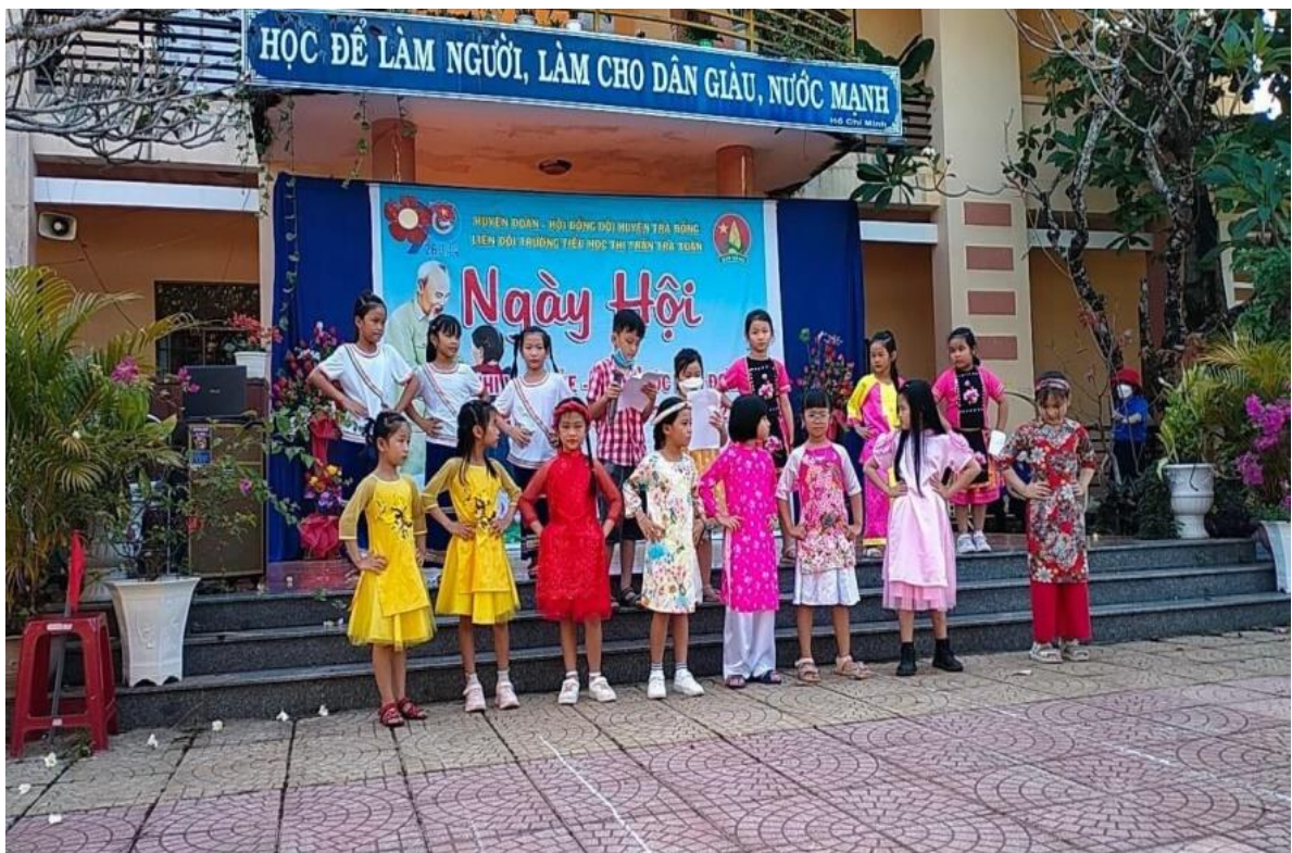
Hình: Tham gia ngày hội Tiến bước lên Đoàn 26/3/2021

Như vậy qua các hoạt động tập thể, ngoài giờ lên lớp, từ đó nếp sống đạo đức của các em sẽ có chuyển biến tốt, trước hết là tinh thần đoàn kết, ý thức tập thể, biết giúp đỡ nhau trong mọi hoạt động. Thông qua các hoạt động tập thể các em có trách nhiệm, mạnh dạn hơn và tự biết chịu trách nhiệm về mình hơn.