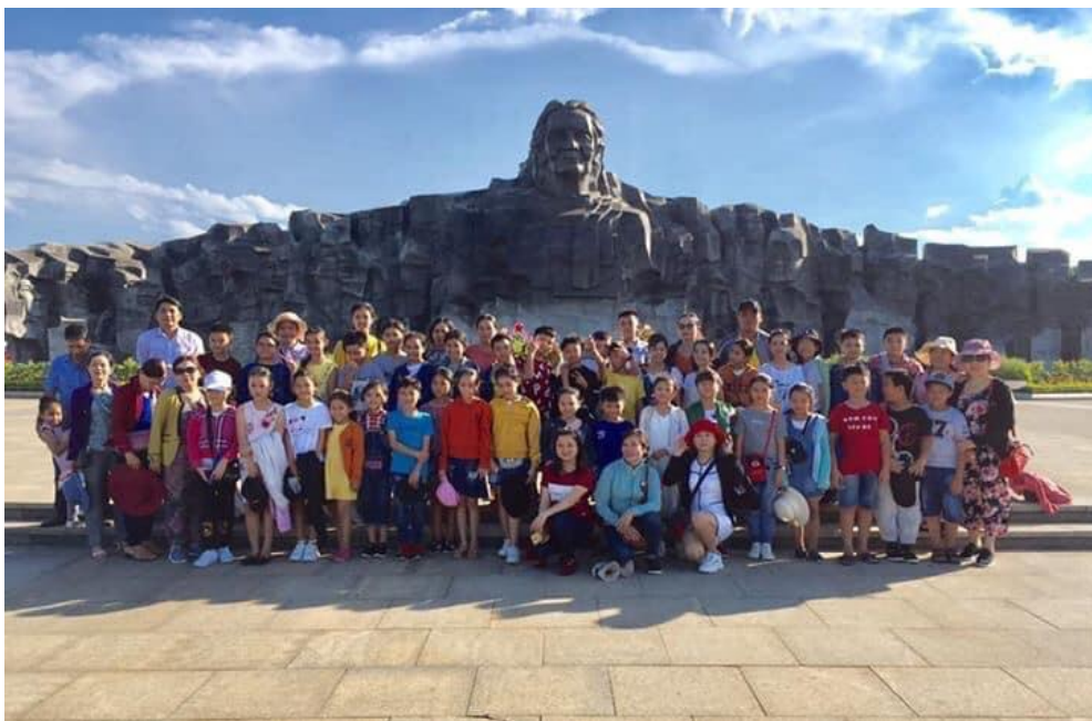
Hình: Giáo viên và học sinh tham quan tượng đài mẹ Thứ (Quảng Nam)

Thông qua các buổi tham quan, học sinh không chỉ hiểu thêm về trang sử hào hùng của dân tộc mà còn thấy tự hào và nhận được ra rằng để mình có cuộc sống như hiện nay thì đã có rất nhiều người đã phải hi sinh xương máu để bảo vệ Tổ quốc. Từ đó, các em sẽ có những hành động thiết thực để thể hiện lòng biết ơn của mình như tích cực tham gia các hoạt động đền ơn đáp nghĩa như: Chăm sóc giúp đỡ gia đình thương binh liệt sĩ, thắp hương và chăm sóc nghĩa trang liệt sĩ; tích cực tham gia phong trào nuôi heo đất để giúp bạn vượt khó trong lớp trong trường, giúp các bạn vùng bị lũ lụt,.... Giúp học sinh biến nhận thức thành những hành động cụ thể chính là sự thành công của người giáo viên chủ nhiệm lớp trong việc giáo dục các em.