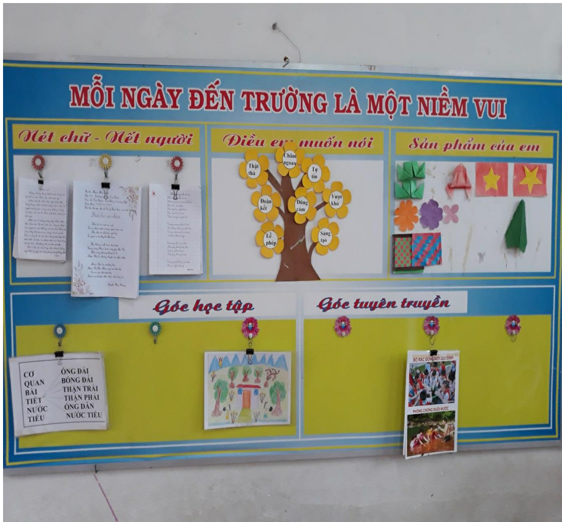
Hình trưng bày sản phẩm