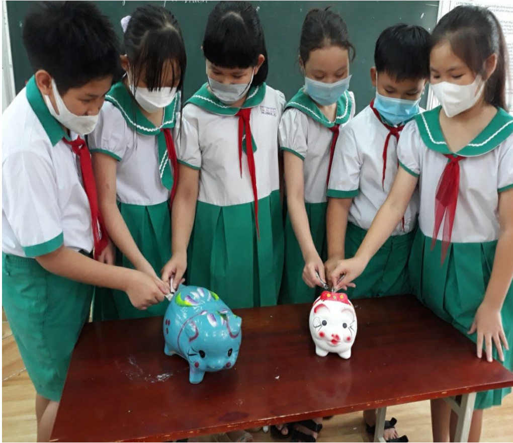
Hình HS nuôi heo đất giúp bạn khó khăn

- Giáo viên chủ nhiệm đôi khi cũng phải đặt mình trong trường hợp mình cũng là học sinh để hiểu trẻ cần gì và chúng ta có thể làm gì để giúp trẻ tiến bộ. Ngoài ra giáo viên còn phải gần gũi các em, tìm hiểu sinh hoạt hàng ngày của trẻ để hướng cho trẻ nhận ra cái đúng để học tập, cái sai để các em tự sửa chữa.