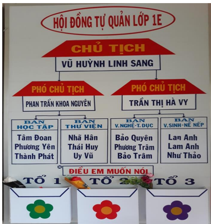
Hình sơ đồ hội đồng tự quản

Trong thực tế nếu học sinh không có nề nếp thì việc giáo dục và dạy học trên lớp sẽ không đạt hiệu quả cao. Đi đôi với chất lượng - kết quả học tập thì công tác xây dựng nề nếp cho học sinh là một trong những nhiệm vụ cần thiết của giáo viên Tiểu học.