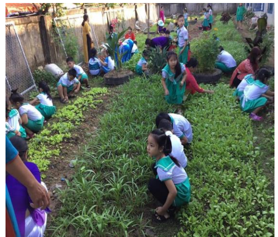
Hình HS chăm sóc cây xanh, rau, hoa