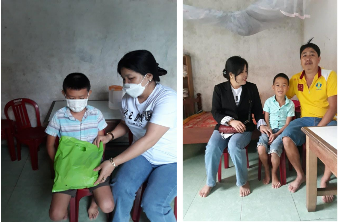
Hình: GV thăm hỏi, tặng quà, phối hợp với phụ huynh