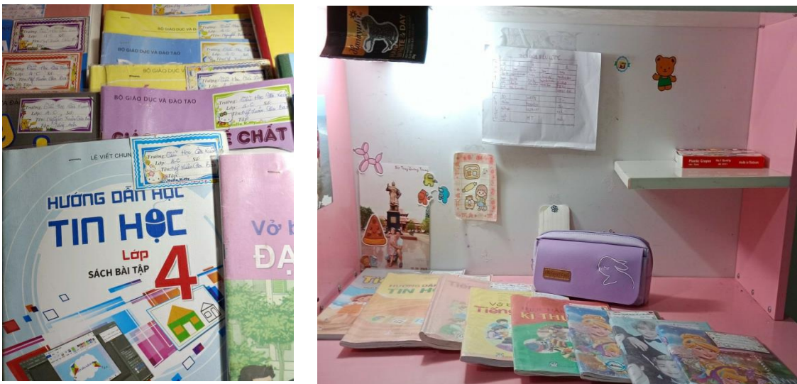
Hình: Góc học tập, bộ sách vở

- Học sinh lớp tôi chủ yếu là con nhà nông nên việc xây dựng nề nếp học tập của các em giáo viên phải nhắc nhở liên tục đồng thời hướng dẫn cụ thể cho các em tạo góc học tập ở nhà, phải chuẩn bị đầy đủ đồ dùng học tập khi đến lớp. Có ý thức giữ gìn, bao bọc sách vở sạch sẽ.