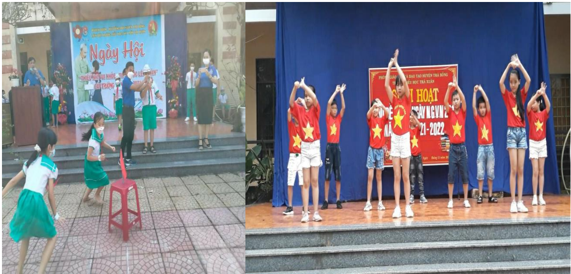
Hình HS sinh hoạt, vui chơi

- Hoạt động ngoài giờ lên lớp cũng là một hoạt động quan trọng góp phần nâng cao chất lượng giáo dục toàn diện, thực hiện mục tiêu giáo dục của nhà trường. Chính từ những hoạt động như: lao động, sinh hoạt tập thể... đã góp phần rất lớn trong việc hình thành nhân cách của học sinh. Để hình thành nhân cách cho học sinh, chúng ta phải thực hiện nhiều hoạt động như hoạt động giảng dạy, các hoạt động giáo dục trong đó hoạt động giáo dục ngoài giờ lên lớp giúp các em vừa học, vừa chơi, giảm căng thẳng trong học tập, tạo cho các em được tính tự tin trong giao tiếp. Đồng thời tăng cường cho học sinh sự hiểu biết thêm về tự nhiên, xã hội, con người.