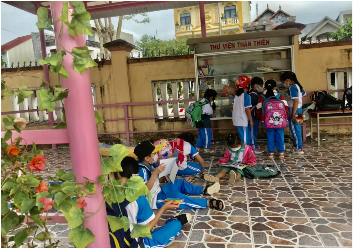
Hình thư viện trường