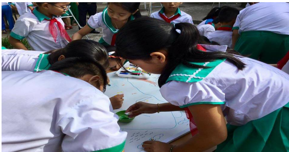
Hình GV dạy thao giảng, HS học nhóm